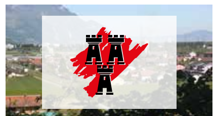
Budget 2019 (p. 38-39)