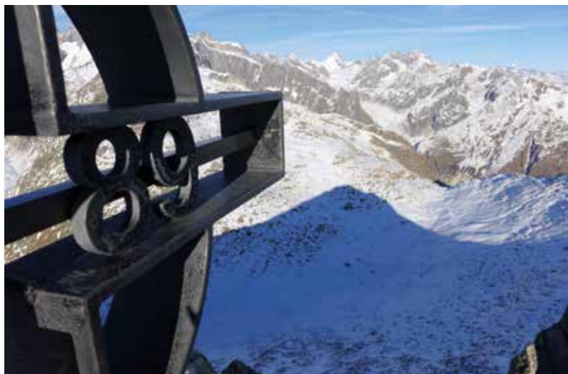
Un chiffre important pour le SC Cime de l'Est.

Cet anniversaire sera marqué dignement par de nouvelles aventures inédites qui attendent les membres du club dont un week-end familial les 16 et 17 mars 2019 à Saas-Fee, dans ce village également appelé « Perle des Alpes » entouré par ses 13 sommets de plus de 4'000 mètres. Un souper sera également mis sur pieds le 12 octobre 2019 à Massongex. Les dates sont déjà fixées, par conséquent, aucune excuse ne sera tolérée pour ne pas profiter de ces moments qui devraient être inoubliables.