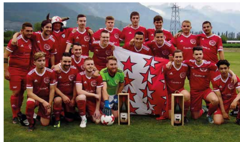
8 juin 2018. Promotion en 4 e ligue des jeunes actifs du FC Massongex (anciennement 2 e équipe).

FC Massongex Le Comité Football club de Massongex info@fcmassongex.ch