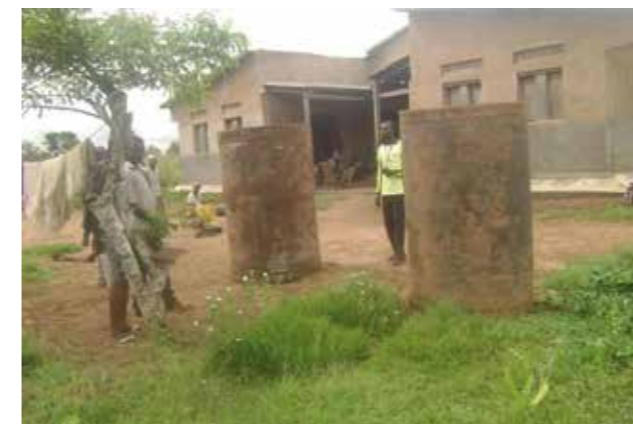
Cuves de récupération des eaux de pluie, roulées sur près de 60 km pour atteindre le centre de Santé en 2017.

Pour toutes ces personnes que nous pouvons soutenir depuis des années grâce à votre générosité, nous vous disons tout simplement MERCI! Belles fêtes de fin d'année à tous!