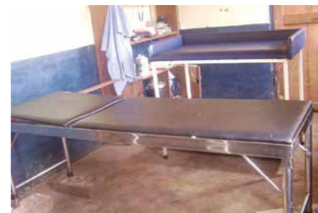
Lit opératoire simple.