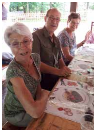
Une journée familiale autour d'un repas.