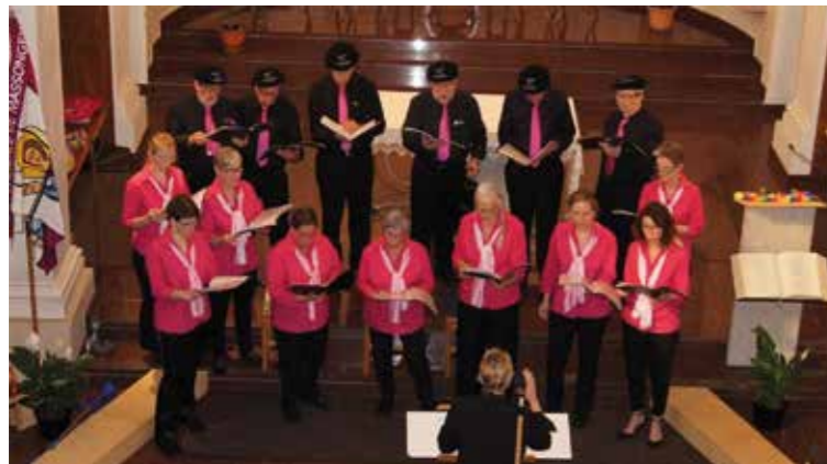
En habit pour un concert.