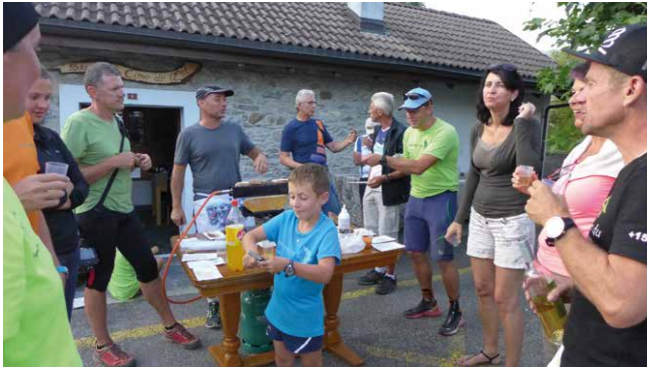
Après l'effort, le réconfort devant le local, lieu incontournable du SC Cime de l'Est.

Contactez-nous pour de plus amples informations: Sebastian Imesch 079 401 45 29 | verobservatoire@multimania.com