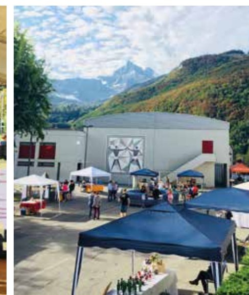
22 septembre 2018. Fête de l'automne à la cour d'école de Massongex.