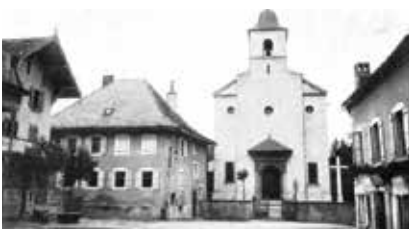
Massongex et ses origines (p. 12-14)