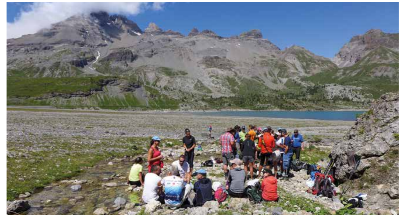
Nos Dents de dos...

Aux environs de midi, les 2 équipes se sont rejointes et ont pu partager un pique-nique en toute convivialité en profitant des conditions idéales qui s'étaient offertes.