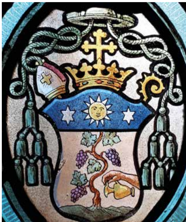
Armoiries de l'évêque Adrien Jardinier telles que représentées sur le vitrail de l'escalier de l'église paroissiale de Massongex (cliché Isabelle Devanthéry-Barman, octobre 2017).