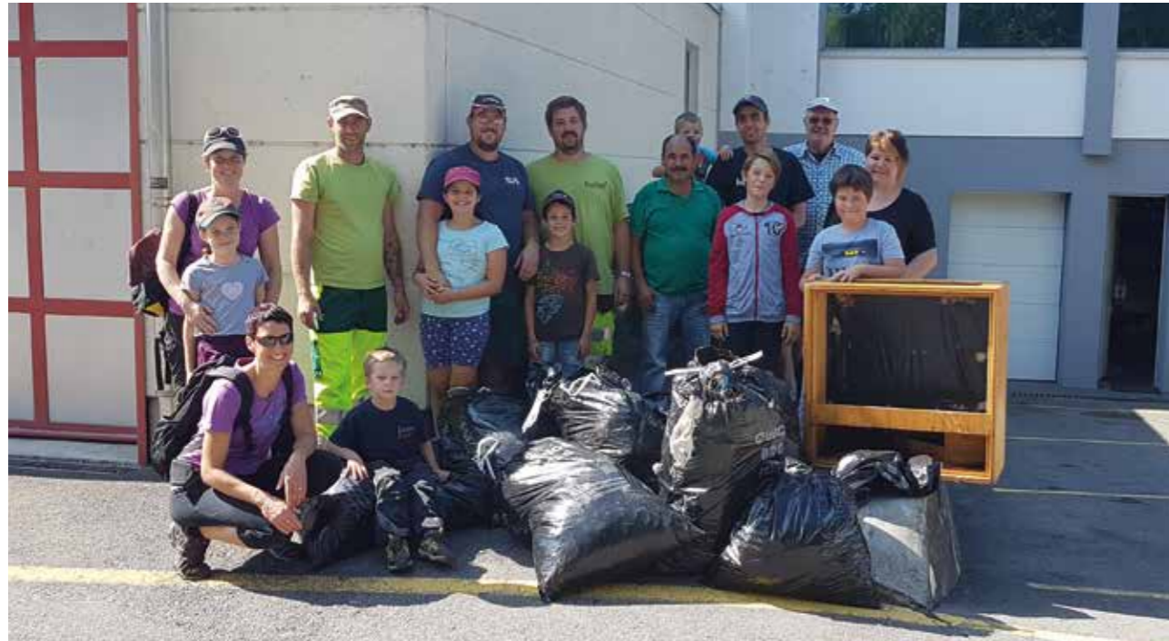
Le 15 septembre dernier s'est déroulée la journée « Clean Up Day ». Cette journée consistait à ramasser les déchets sauvages sur le territoire communal.