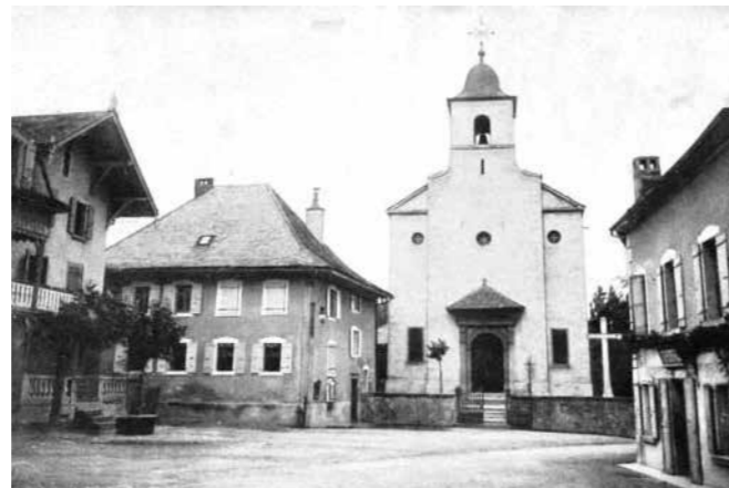
Place de l'église.