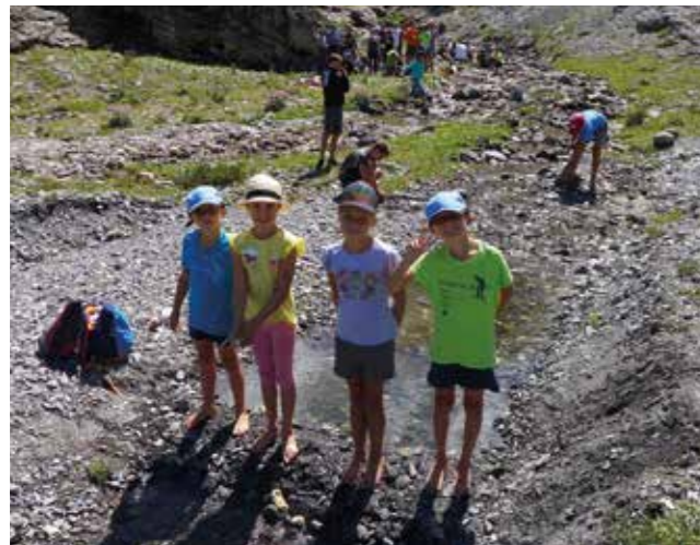
Les chaussures de ski ne sont pas encore de mise.

La 30 e saison du SC Cime de l'Est a débuté lors de cette magnifique journée du 15 août dernier. Deux parcours à choix avaient été proposés au préalable aux membres du ski-club. L'un, destiné à tout un chacun, qu'on nommera le parcours familial et l'autre, le parcours sportif, pour les marcheurs avertis.