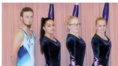
FSG La Loënaz (p. 26-29)