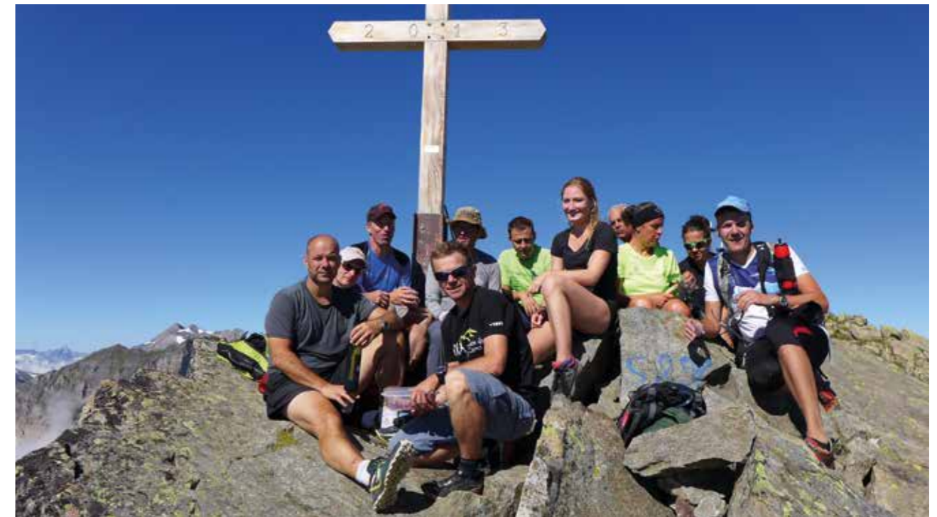
Plus c'est haut, plus c'est beau!

Aux environs de midi, les 2 équipes se sont rejointes et ont pu partager un pique-nique en toute convivialité en profitant des conditions idéales qui s'étaient offertes.